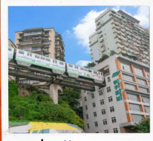
นั่งรถไฟทะลุตึก