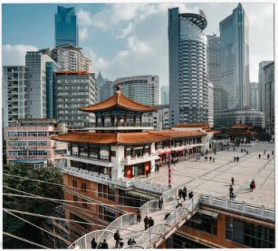
ตึกหุยซิง (ตึก 22ชั้น)