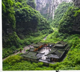
อุทยานหลุมฟ้า สะพานสวรรค์