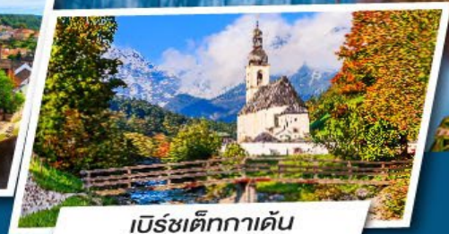
เบิร์ชเต็กกาเดิน