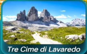
Tre Cime di Lavaredo