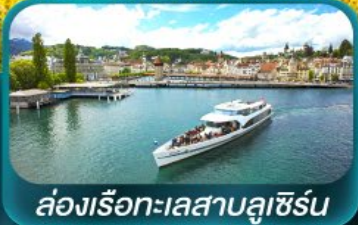
ล่องเรือทะเลสาบลูเซิร์น