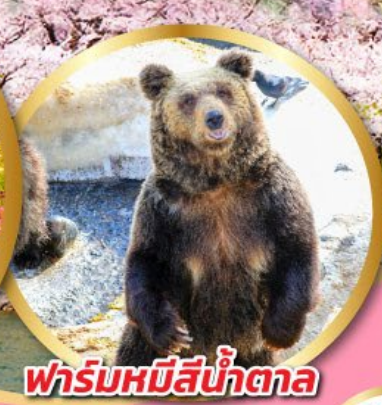
ฟาร์มหมีสีน้ำตาล