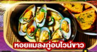
หอยแมลงภู่อบไวน์ขาว