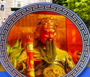
วัดกวนโถ