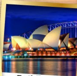
ซิดนีย์โอเปอรา