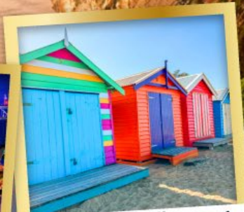
โบสถ์ต้น บาร์ตัง บ็อกซ์