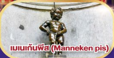
แมนกันพีส (Manneken pis)