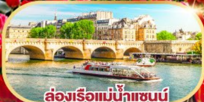
ล่องเรือแม่น้ำแซนน์