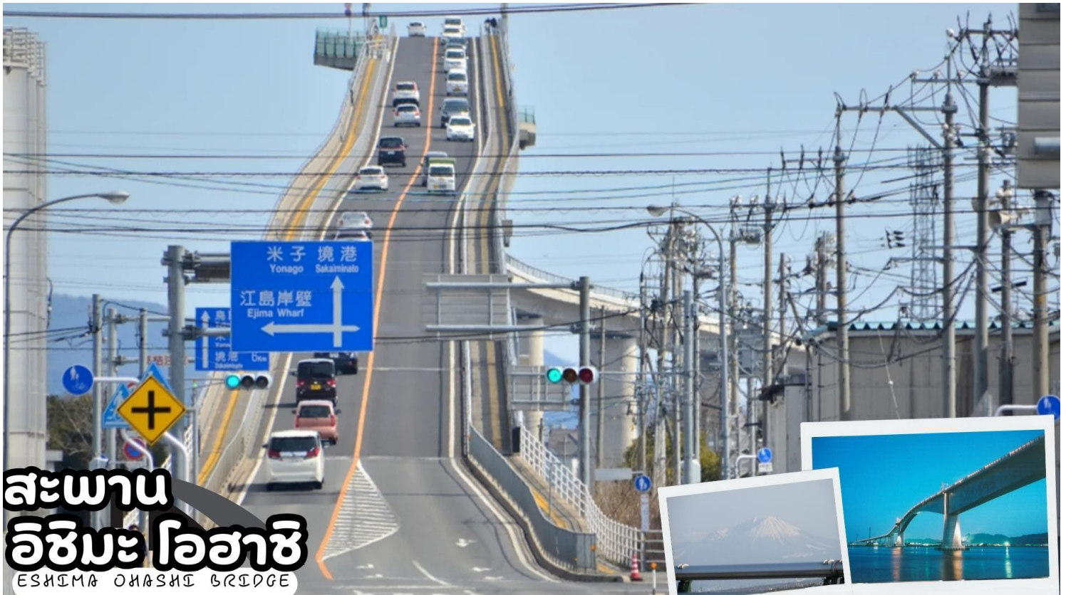
สะพานอิชิมาโอะฮาชิ ESHIMA OHASHI BRIDGE

นำท่านชม ศาลเจ้าอิซุโมะไทชะ (Izumo Taisha Grand Shrine) เชื่อกันว่าจะมีเทพเจ้ามารวมตัวกันในเดือนตุลาคมของทุกปี และยังมีชื่อเสียงว่าเป็นสถานที่ที่ช่วยเสริมดวงชะตาด้านความรัก ส่วนเครื่องรางก็ได้รับความนิยมเป็นอย่างมากและว่ากันว่าให้โชคด้านความรัก นอกจากนี้มักจะถูกใช้เป็นสถานที่สำหรับพิธีแต่งงานอีกด้วย หากโชคดีก็อาจจะมีโอกาสได้เห็นพิธีแต่งงานแบบญี่ปุ่นที่มีเสน่ห์น่าหลงใหล บริเวณรอบๆศาลเจ้ายังเป็นจุดชมซากุระที่มีชื่อเสียงอีกแห่งหนึ่งของญี่ปุ่น มีดอกซากุระประมาณ 200 ต้นจาก 15 สายพันธุ์ที่แตกต่างกัน บานสะพรั่งกันในบริเวณนี้ เริ่มตั้งแต่ดอกซากุระในฤดูหนาวในเดือนกุมภาพันธ์ เพลิดเพลินกับการชมดอกซากุระได้ตลอดเส้นทาง ไปยังศาลเจ้าหลักและตามสระน้ำของศาลเจ้า ช่วงเวลาที่ที่ดีที่สุดในการชมดอกซากุระคือช่วงปลายเดือนมีนาคมถึงต้นเดือนเมษายน (ซากุระขึ้นอยู่กับสภาพอากาศ)