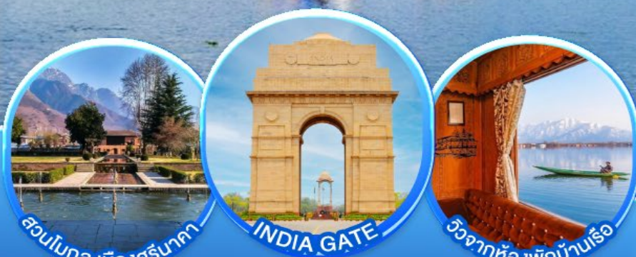
สวนโมกุล เมืองศรีนาคา INDIA GATE วิวจากห้องพักผ่อนเรือ