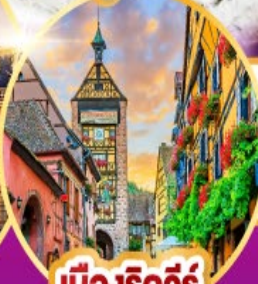
เมืองริควีร์