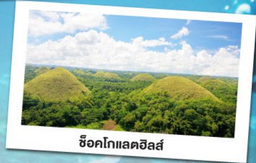
ช็อกโกแลตฮิลล์