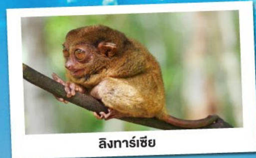
ลึงทาร์เซียร์