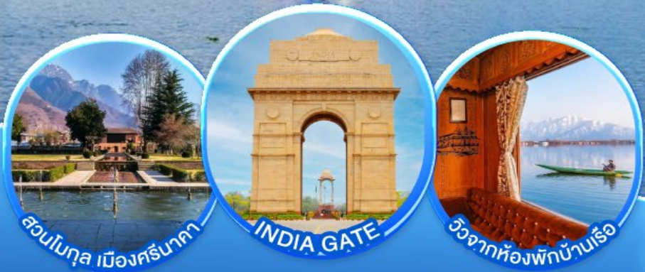
สวนโมกุล เมืองศรีนาตา