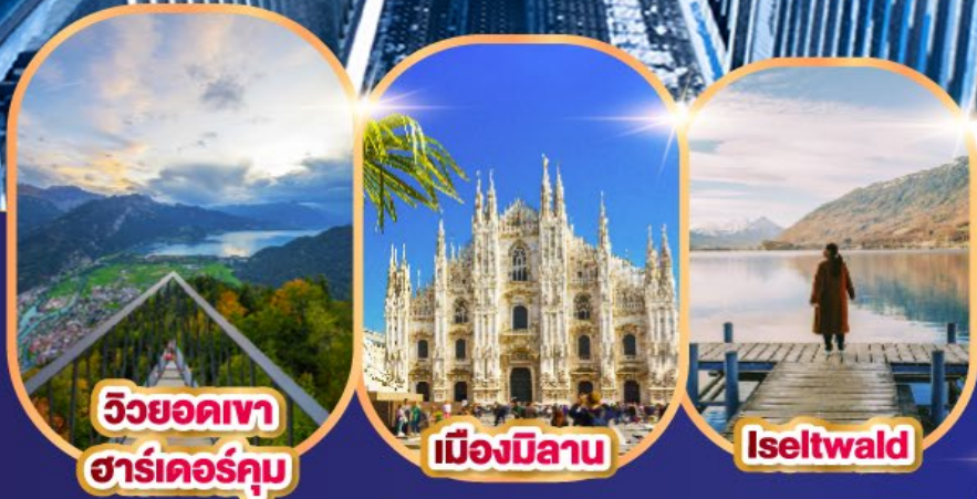
วิวยอดเขา ฮาร์เตอร์คัม