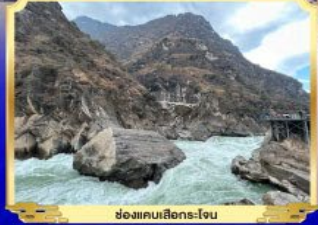
ช่องแคบเลิเกอร์-โจน