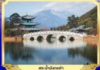
สะพานมังกรดำ