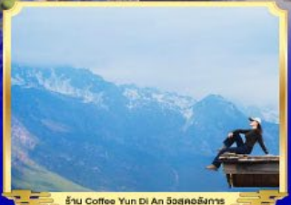
ร้าน Coffee Yun Di An 雲迪安咖啡館