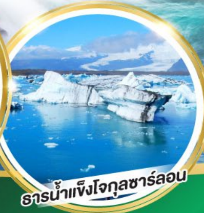
ธารน้ำแข็งโจกุลชาร์ลอน