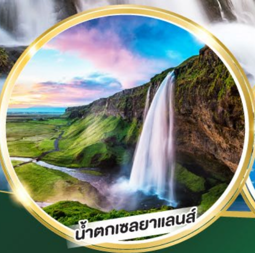
น้ำตกเซลยาแลนส์