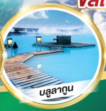
บลูลาทูน