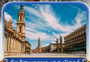
จัตุรัสพลาซ่า เดล ฟัลาร์