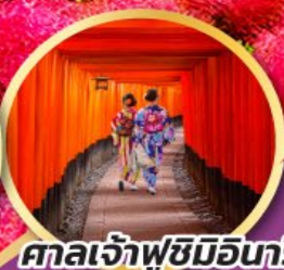
ศาลเจ้าฟูชิมิอินาริ