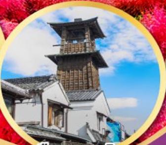
เมืองคาวาโกเอะ