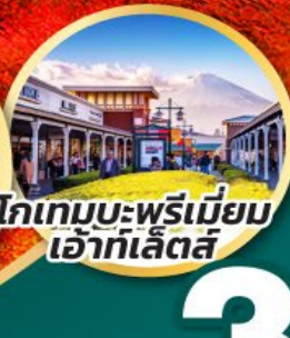
โทเทมบะ-พรีเมียม เอ้าท์เล็ตส์