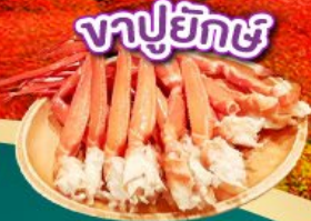
งาปูยักษ์