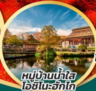
หมู่บ้านน้ำใส โอชิโนะอ๊กโก