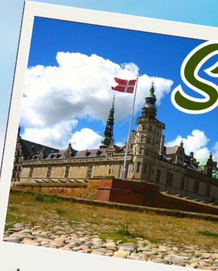
ปราสาทโครนบอร์ก (Kornborg)