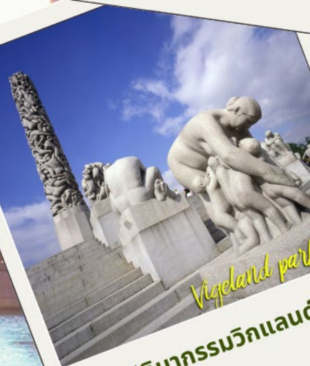
สวนประติมากรรมวิกแลนด์