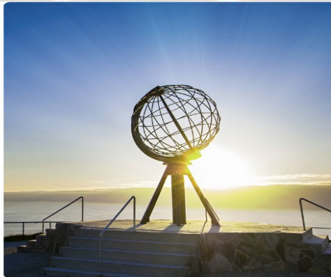
สัมผัสดินแดนโวกิ้งชม พระอาทิตย์เที่ยงคืน