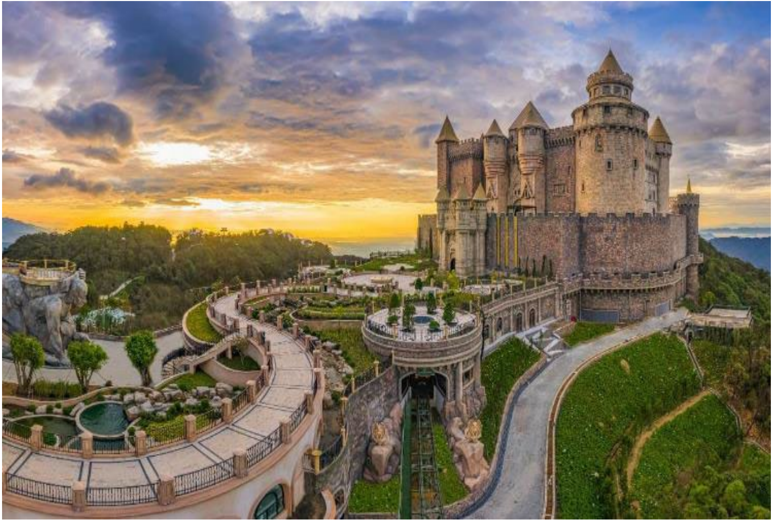
กลางวัน รับประทานอาหารกลางวัน ณ ภัตตาคาร (มีที่ 2) * เมนูพิเศษ บุฟเฟ่ต์นานาชาติ บนบานาฮิลล์