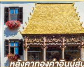
หลังคาทองคำอินน์ส์บรุค