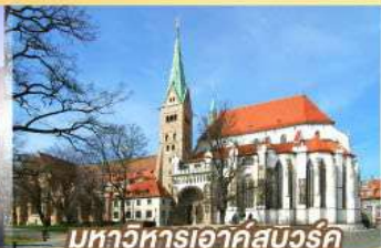
มหาวิหารเอาค์สเวิร์ค