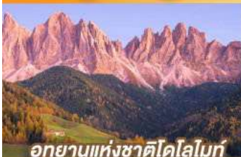
อุทยานแห่งชาติโดโลไมท์

บินตรงนครอัมสเตอร์ดัม กับเส้นทางสายโรแมนติก พร้อมการแสดงพื้นบ้านสไตล์ที่โรเลียนสุดพิเศษ