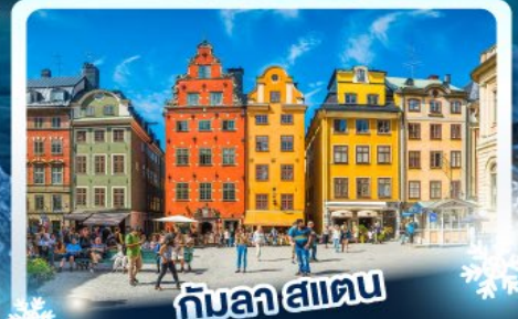
กินลาสแตน