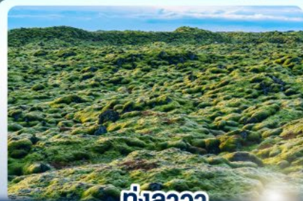
ทุ่งลาวา