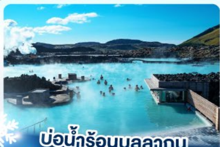
แช่น้ำร้อนบลูลากูน

เก็บไอซ์แลนด์ แคนยูกาไฟร์กรูฟ และ แช่น้ำร้อนบลูลากูน