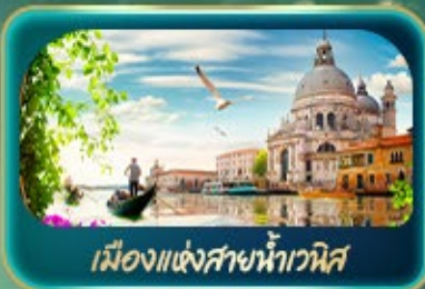
เมืองแห่งสายน้ำเวนิส

จุดบรรจบความอลังการของธรรมชาติ Dolomites และ ทะเลสาบมิซูริน่า ชมน้ำสีเทอร์ควอยซ์ ทะเลสาบเบรียส สตรีโรเมนติกาเมืองแห่งสายน้ำเวนิส ห้าพลาต มหาวิหารดูโอโมแห่งมิลาน โรบิน อาธิน่า บ้านของจูเลียต เที่ยวลูเซิร์น ชมสิงโตหินแกะสลัก เดินเล่นสะพานไม้อาเปลา อินส์บรุค ย้อนอดีตกับเสาชนต์แอนน์ หลังคาทองคำ ช้อปปิ้ง Outlet