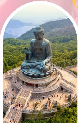
นั่งกระเช้ามองปิง นมัสการพระใหญ่โป่วหลิน