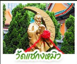
วัดเขกงหนิว