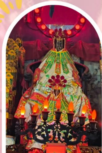
วัดเจ้าแม่กวนอิมฮ่องกง ขอพรเรื่องเงิน ทรัพย์สิน และความมั่นคง