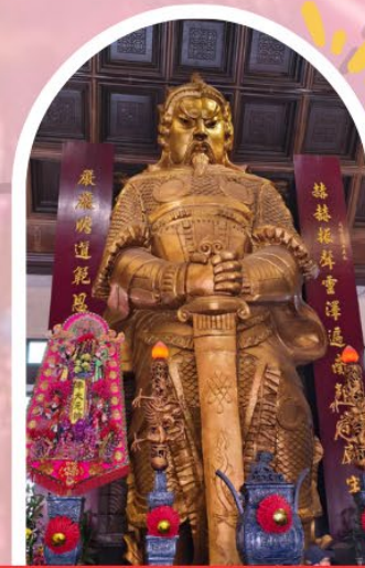
วัดแชกง ขอพรโชคลาก การเงิน และธุรกิจ