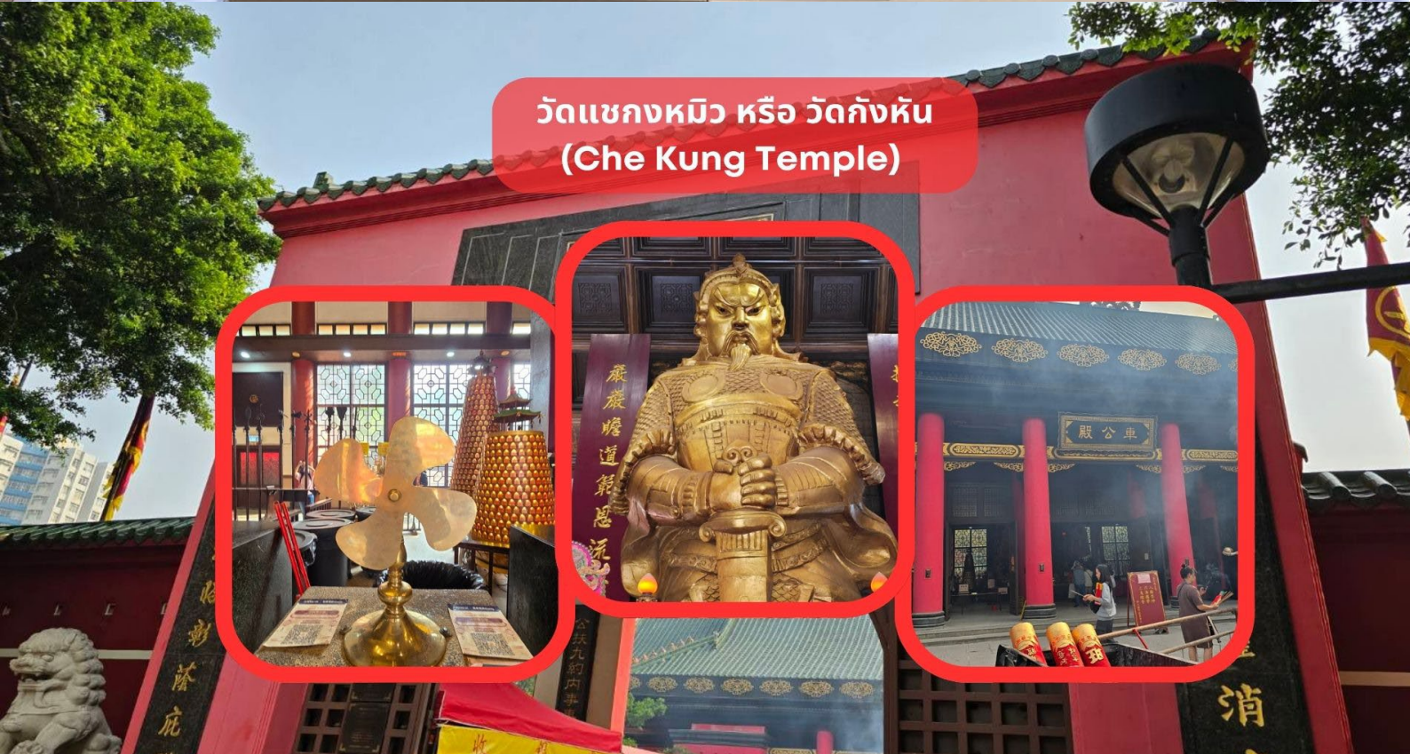
วัดเขกงหมิว หรือ วัดกึงหัน (Che Kung Temple)