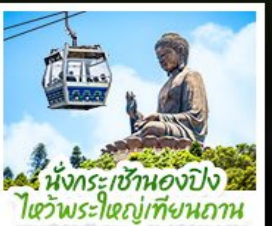
นั่งกระเช้าเองปัง ไหว้พระใหญ่เทียนถาน