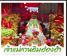
เจ้าแม่กวนอิมชองฮ่า