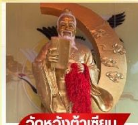
วัตต์ห้วงต้าเซี่ยน