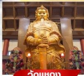
วัตต์แซก