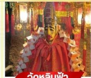
วัตต์หลิบฟ้า