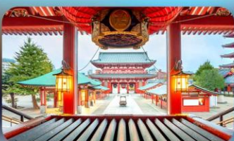
วัดเซ็นโซจิ

HOTEL HEDISTAR NARITA หรือเทียบเท่ามาตรฐานญี่ปุ่น